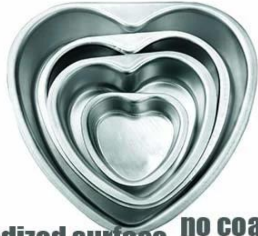
anodized surface no coating