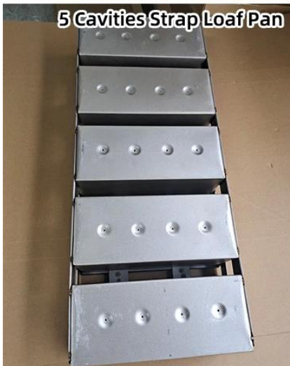
5 Cavities Strap Loaf Pan