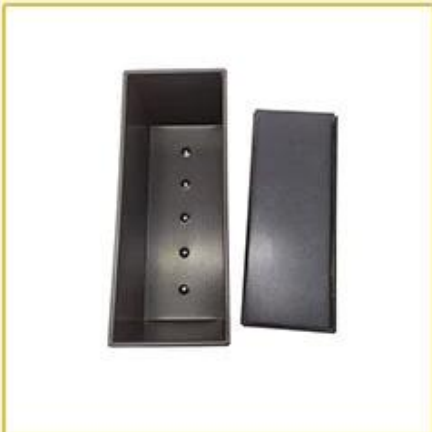
holes at bottom