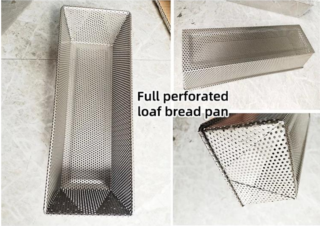
Full perforated loaf bread pan