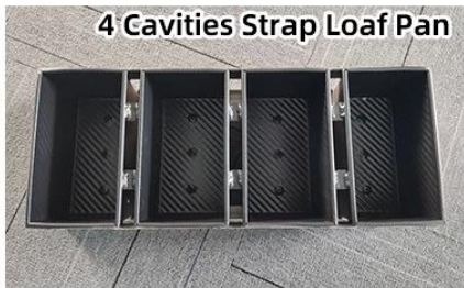
4 Cavities Strap Loaf Pan