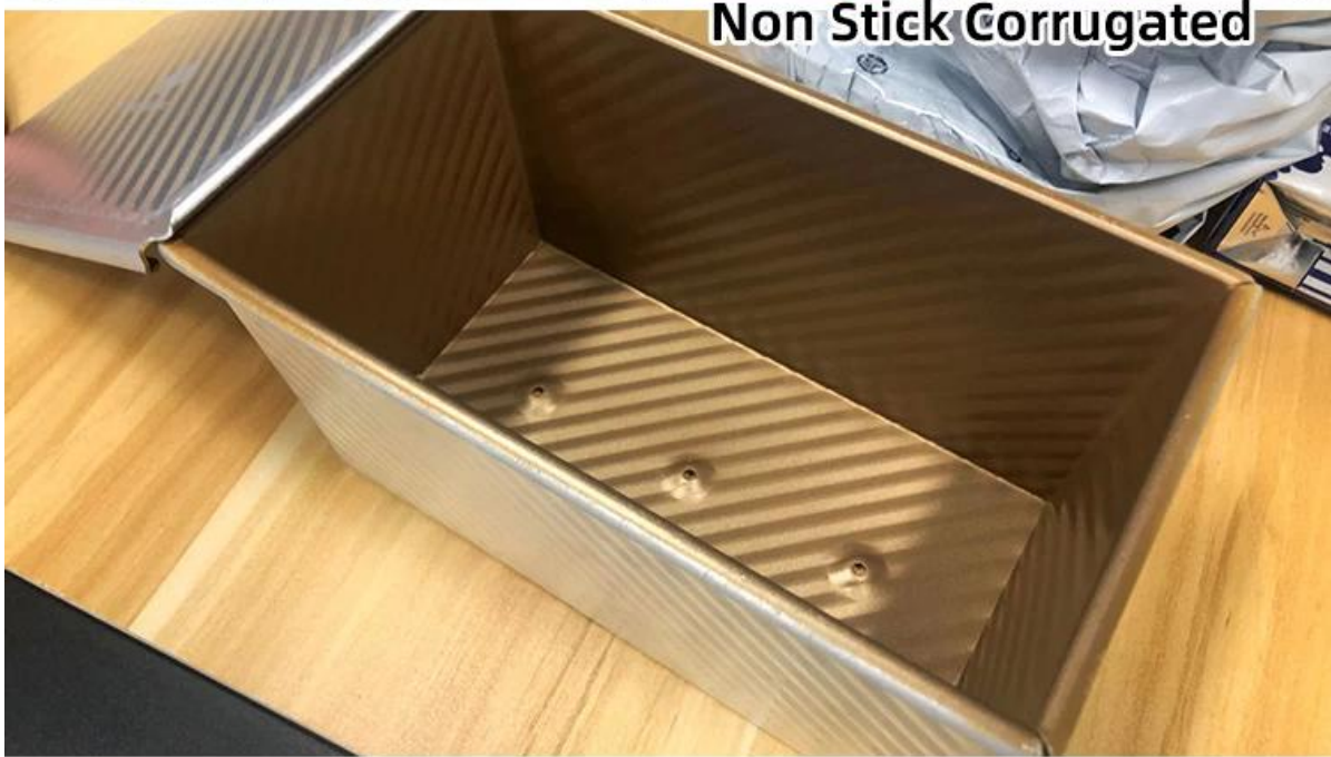
Non Stick Corrugated