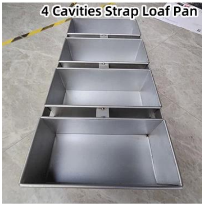
4 Cavities Strap Loaf Pan