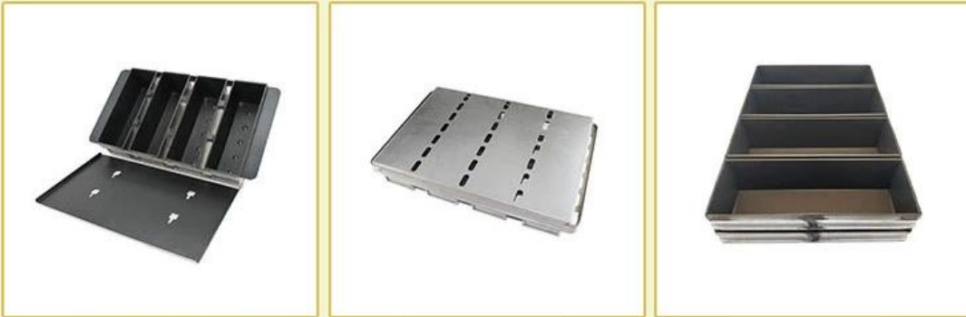
with buckled lid