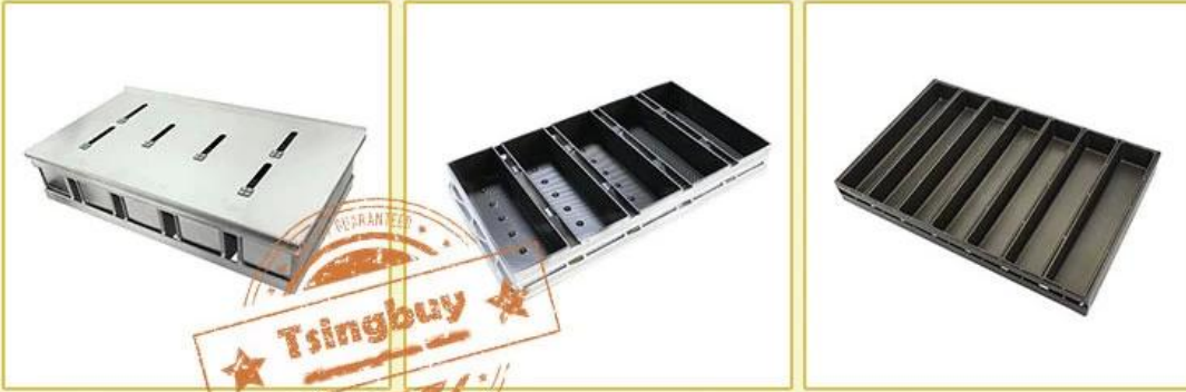
4/5 straps with lid

Available for food factory machinery lines