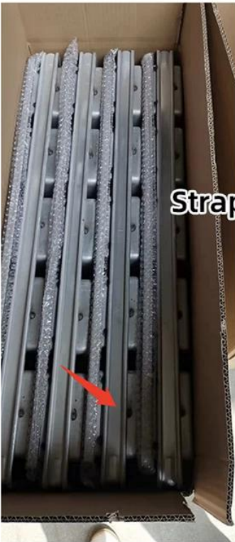
Strap Loaf Pans