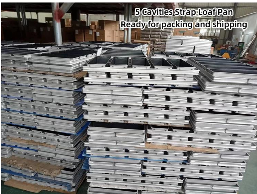
5 Cavities Strap Loaf Pan Ready for packing and shipping