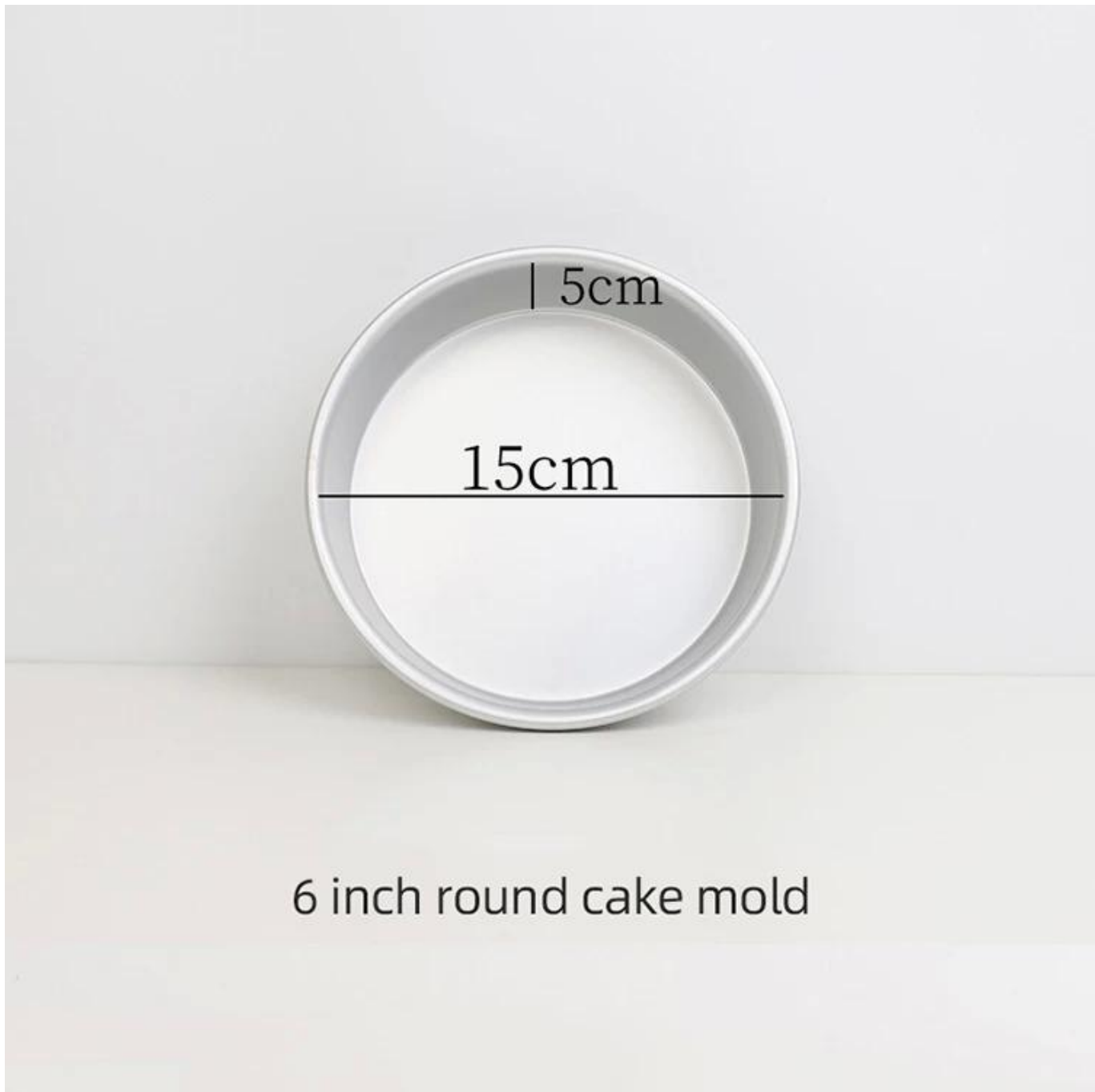
6 inch round cake mold