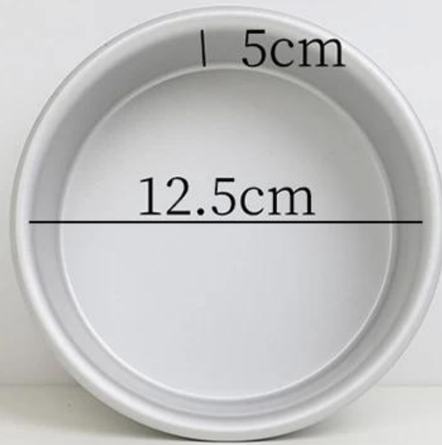
5 inch round cake mold