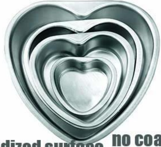
anodized surface no coating