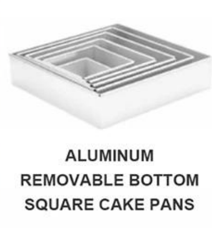
ALUMINUM REMOVABLE BOTTOM SQUARE CAKE PANS