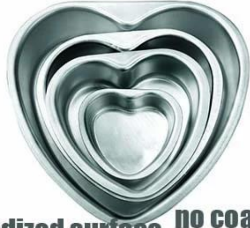
anodized surface no coating