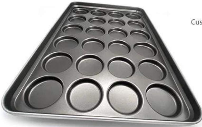
Custom 24-molds hamburger baking pan